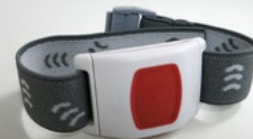
Funksender wahlweise zum Tragen am Handgelenk, um den Hals oder am Gürtel.

Für eine schnelle Hilfe und Vermeidung von erheblichen Sachschäden (z. B. im Notfall ein Aufbrechen der Türen) ist die Schlüssel hinterlegung empfehlenswert. Ein fremder Zugriff ist dabei ausgeschlossen.