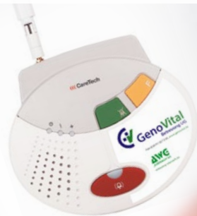
Hausnotrufgerät mit Funk-Antenne

Nicht immer ist das rettende Telefon in greifbarer Nähe oder Verwandte, Bekannte, Freunde und Nachbarn erreichbar.